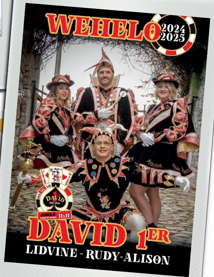
Prinz WeHeLo 2025